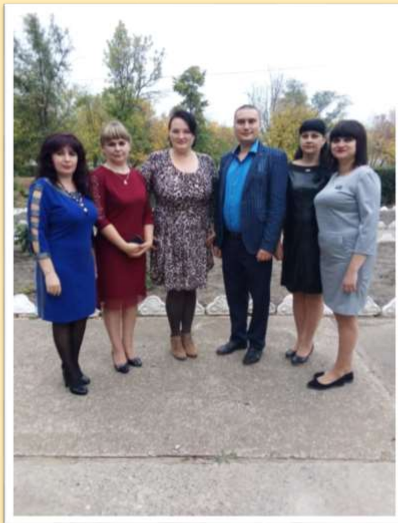
Методична комісія з професії “Оператор комп’ютерного набору; обліковець з реєстрації бухгалтерських даних”